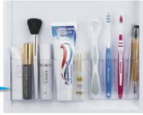
TW-T55L (LEDタイプ) 使用例